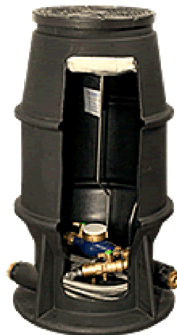
Ausführung mit eingangsseitigem Schrägsitzventil und ausgangsseitigem KSR-Ventil